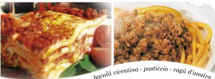
bacalá vicentina - pasticcio - ragù d'anatra